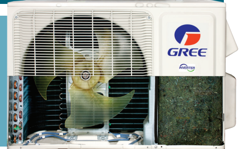
base avec élément chauffant

GREE équipe l'unité extérieure de l'Extreme d'une base avec élément chauffant qui empêche le gel de condensat et assure la pleine efficacité de l'appareil et une puissance de chauffage maximale.